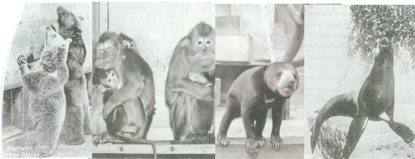
Zoologisk Have, Nykøbing F. Brune Bjørne.