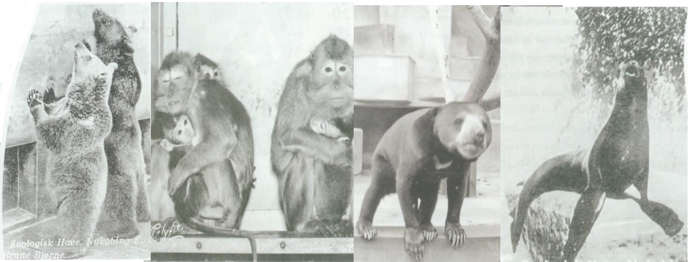
Zoologisk Have, Nykøbing F. Brune Bjørne.